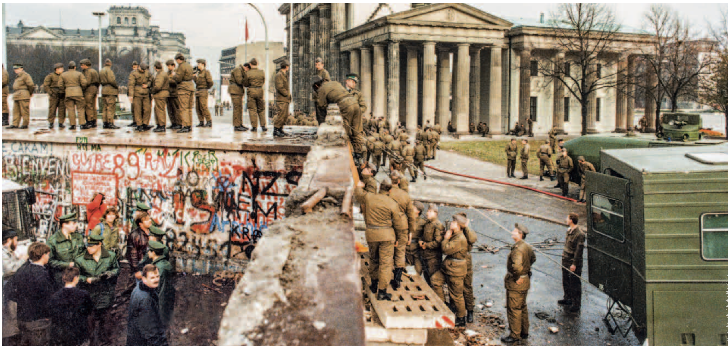
Folksamling framför Berlinmuren i Västberlin den 14:e november 1989 med östtyska gränsvakter ståendes på muren framför Brandenburger Tor i Östberlin, Östtyskland i samband med murens fall.