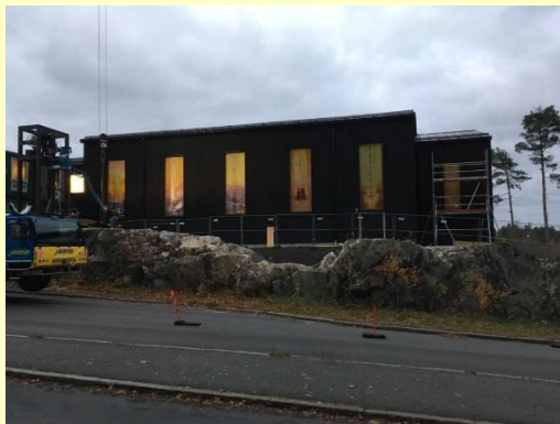
Kyrkfönstren lyser upp

Vid ingången av kyrkan står nu ett klocktorn med två klockor, som har gjorts av Tony Kempe – Ohlssons klockgjuteri i Ystad. Klockorna och klocktornet är en gåva av S:t Ansgarius-Werk Köln. I förra nyhetsbrevet beskrev vi utförligt klockornas inskription, ton och vikt.