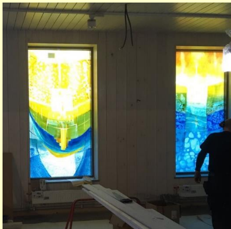
Blå-gula fönster i Mariakapellet