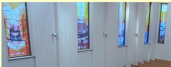
I nedre delen av fönstren står Ave Maria bönen på kaldéiska